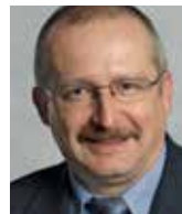
Supersaxo Zeno, Dr. med., 1962 vdi Saas Balen (VS), a Hünibach (BE)

Studi di Medicina (Università di Berna) con laurea. Formazione continua, tra le altre nel Nord-America. Dal 1985 al 1990 specializzazione in cliniche e ospedali svizzeri. Dal 1996 in funzione responsabile presso l'Ospedale universitario di Zurigo; dal 1999 al 2009 direttore della Clinica e Policlinica per Medicina fisica e Riabilitazione e nel Comitato direttivo dell'Istituto per Scienze della salute e riabilitazione presso l'Università Ludwig-Maximilian di Monaco di Baviera. Direttore e titolare della cattedra di Scienze e Politica della salute dell'Università di Lucerna. Direttore dell'ICF Research Branch WHO. Foreign Associate dell'Institute of Medicine of the National Academies, USA, membro di numerosi collegi di discipline specialistiche.