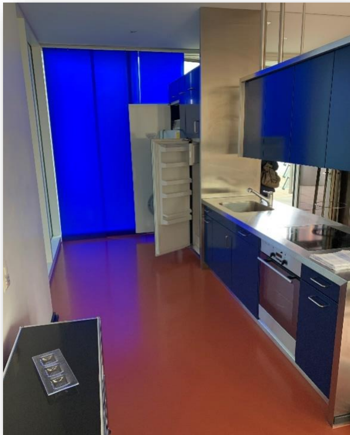
Eigene Küche mit Kühlschrank. Eine Waschmaschine und ein Waschtrockner sind vorhanden