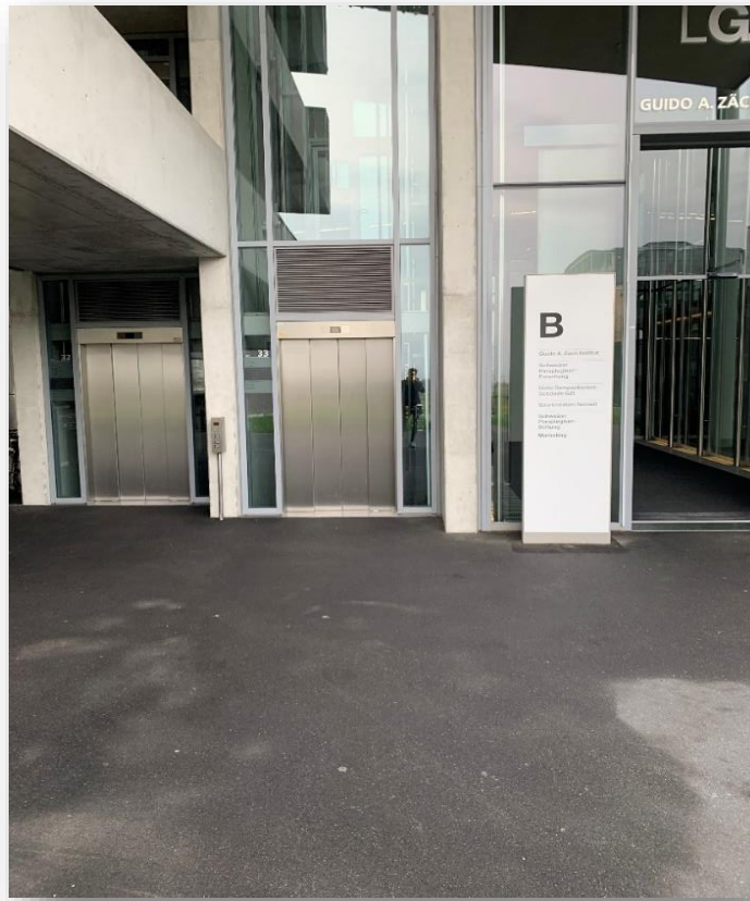
Lift neben dem GZI-Eingang. Die Studios befinden sich im letzten Stock