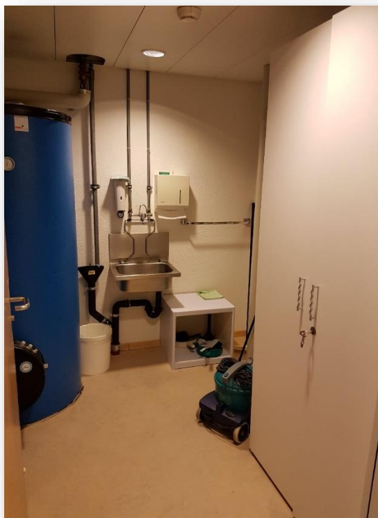
Auf der Etage der Studios (1. Stock) findet man den Putzraum.