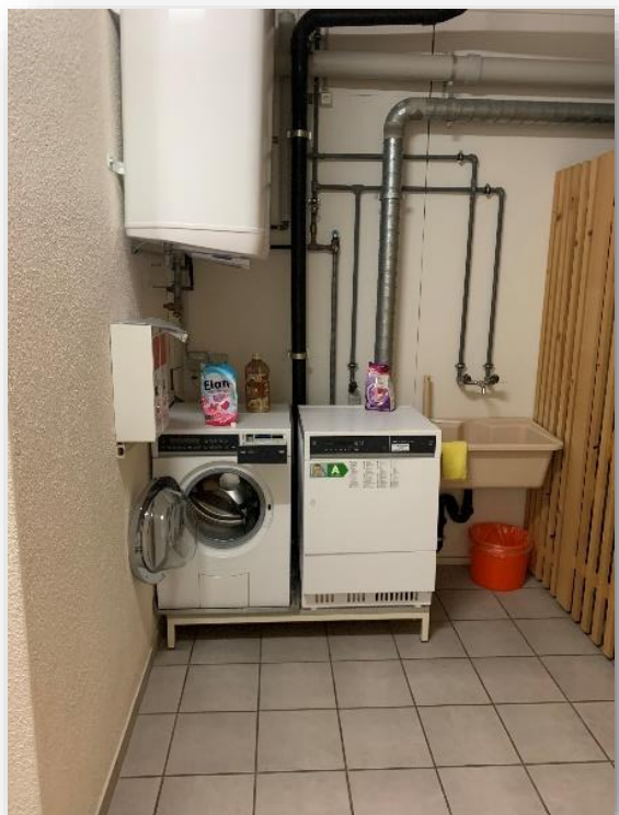
Diese Gerätschaften stehen im Waschraum zur Verfügung