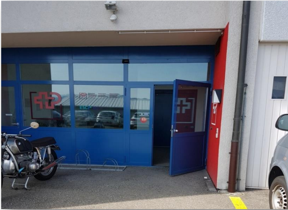
Am Hintereingang (UG) befindet sich eine breite, automatische Tür, durch die das Gebäude vor allem für Rollstuhlfahrer am besten befahren/ betreten werden kann