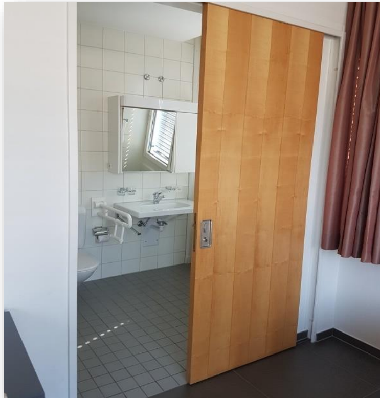
Schiebetür zum Schlafrum