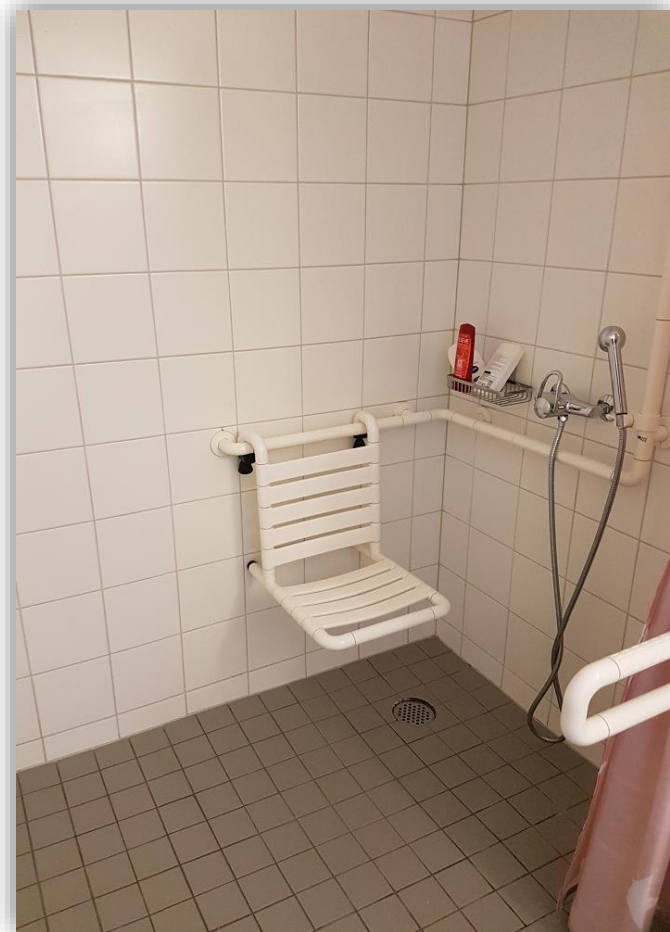
Bei Bedarf kann ein Dusch-Sitz montiert werden