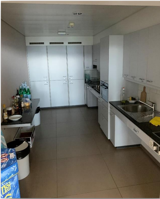
Gemeinschaftsküche mit eigenem Kühl- und Vorratsschrank zu jedem Studio