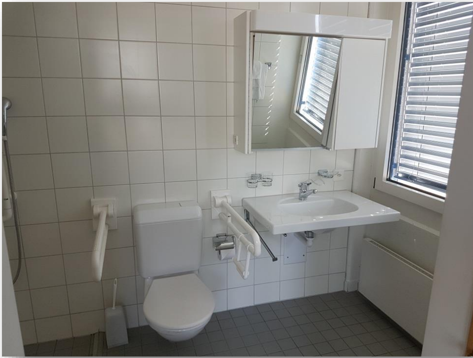
Toilette mit Hilfsvorrichtungen