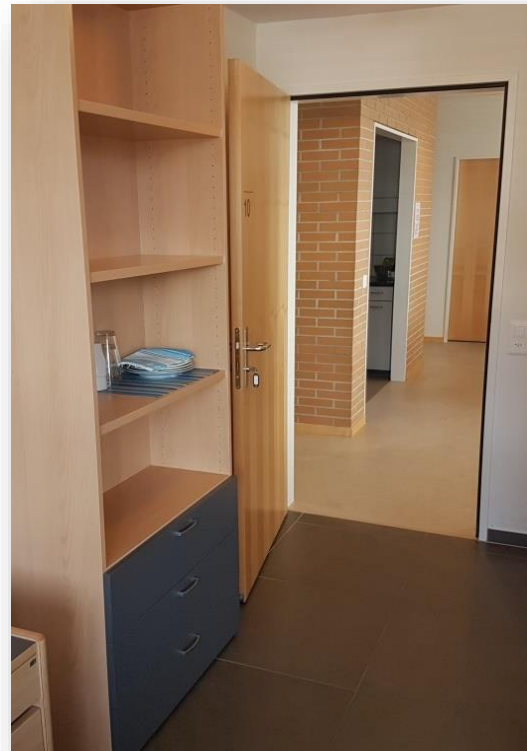
Es ist genügend Stauraum vorhanden