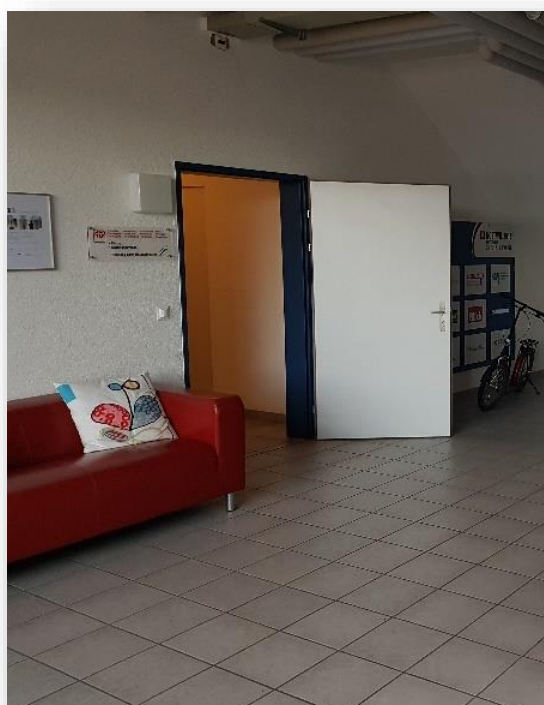
Auf demselben Stock (UG) gelangt man links vom Lift zum Waschraum (siehe offene Tür im Bild)