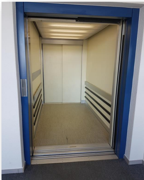
Der Lift ist geräumig