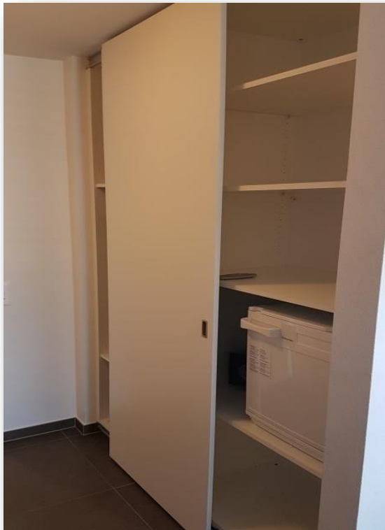
Kleiner Kühlschrank und Tresor im eigenen Studio