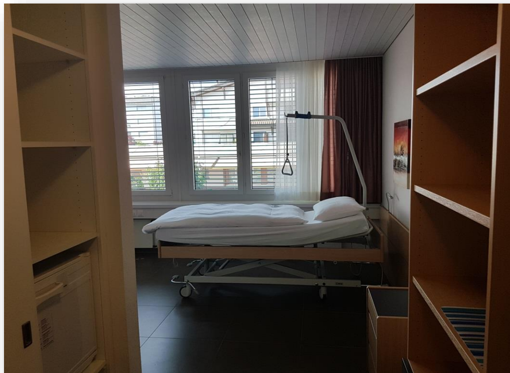
Studio 10 mit Pflegebett und Schaumstoffmatratze DUO NORM (grün)