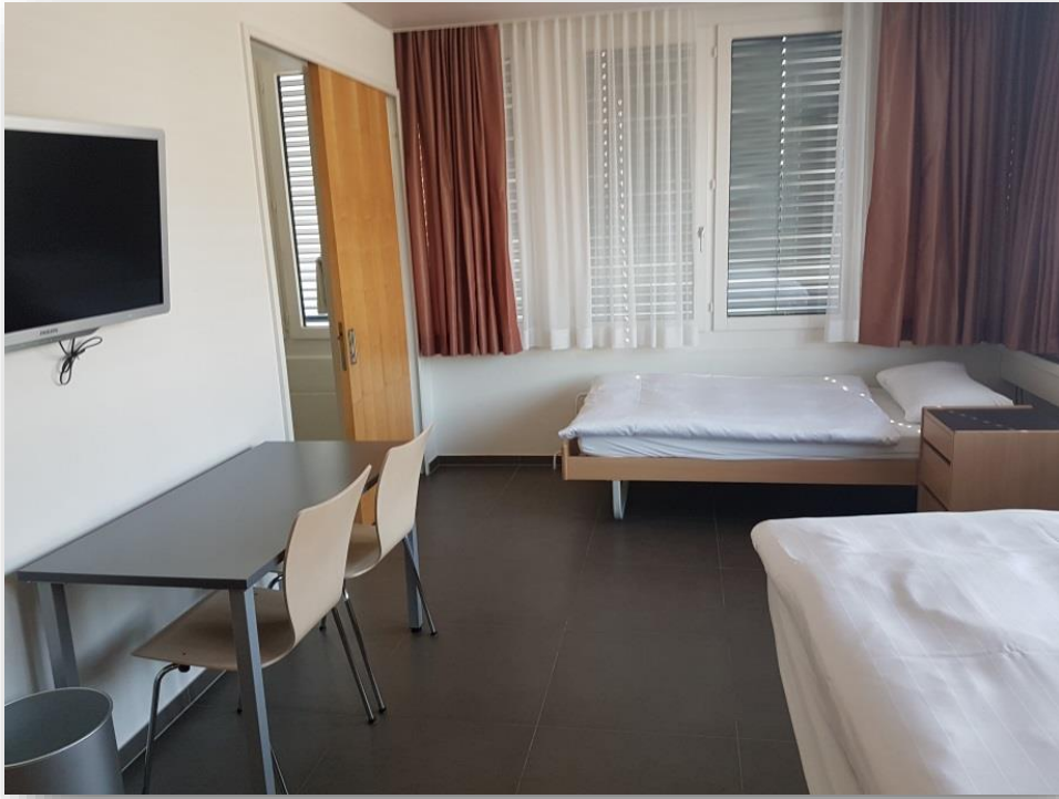
In jedem Studio hat es zwei Betten und ein Pult