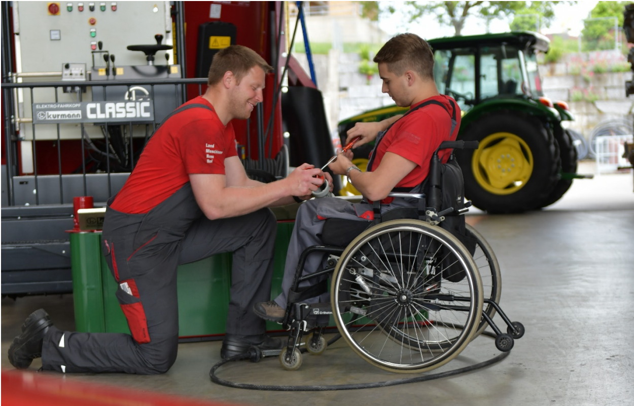
Record mondial : plus de 60 % des paralyzé-es médullaires suisses sont réintégré-es dans le monde du travail.