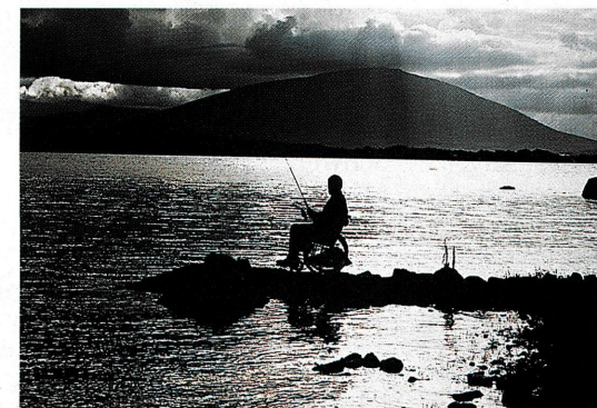
«Angeln in Irland»: Wolfgang Wegner