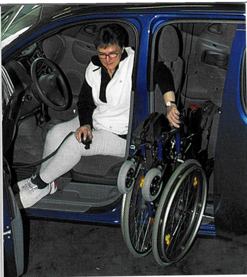
Wenig Umtriebe: Das Verladen des Rollstuhls verlangt fallweise unterschiedliche Vorrichtungen.

zu schaffen. Für Paraplegiker oder Menschen mit einer anderen Gehbehinderung geschieht dies mittels standardisierter Umstellung auf Gasring und Stossbremse. Bei Autos für Tetraplegiker, die von einer höheren Lähmung betroffen sind, wird anstelle von Gas- und Bremspedal meistens ein Kombihebel eingesetzt. Eine drehbare Gabel am Lenkrad, die Anpassung der Servolenkung oder der Einbau eines Drehknopfes mit integrierter elektrischer Bedienung auf dem Lenkrad sind erprobte, zuverlässige Hilfen. Sie gestatten Querschnittgelähmten das sichere Steuern ei-