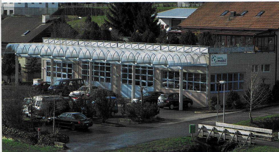
Erste Adresse für Umbauten: Domizil der Paramobil AG in Nottwil, wo erfahrene Spezialisten am Werk sind.

auch ich als Gehbehinderter soziale Kontakte pflegen und Bekannte besuchen, oder muss ich mich immer besuchen lassen? Und wie steht es mit selbstständigem Einkaufen, mit dem Besuch eines Konzertes oder gar einer Reise in die Ferien? Im Schweizer Paraplegiker-Zentrum Nottwil beschäftigt man sich frühzeitig damit, die von Fall zu Fall richtigen Antworten darauf zu finden.