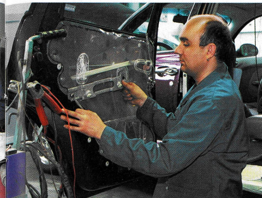
...und seine Mitarbeiter achten auf jedes Detail.

ramobil AG Nottwil, in direkter Nachbarschaft zum SPZ Nottwil gelegen, für viele Patienten schon während der Rehabilitationszeit zu einem wichtigen, kompetenten Ansprechpartner.