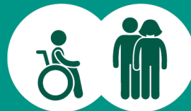
querschnitt- und nicht querschnittgelähmte Menschen