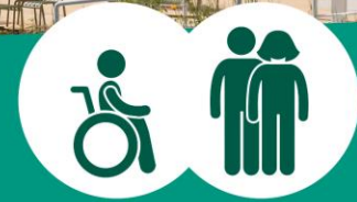
querschnitt- und nicht querschnittgelähmte Menschen